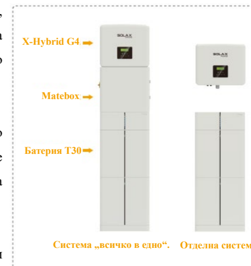
Система „всичко в едно“. Отделна система.

Мониторинг и анализ в реално време със SolaX Cloud: предоставяне на информация за оптимизиране на потреблението на енергия и подобряване на цялостната производителност на системата.